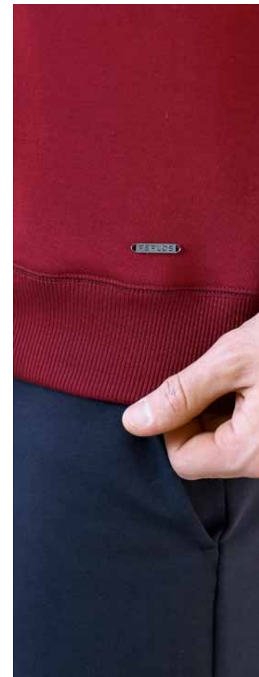
Свитшот Peplos SW19007-R