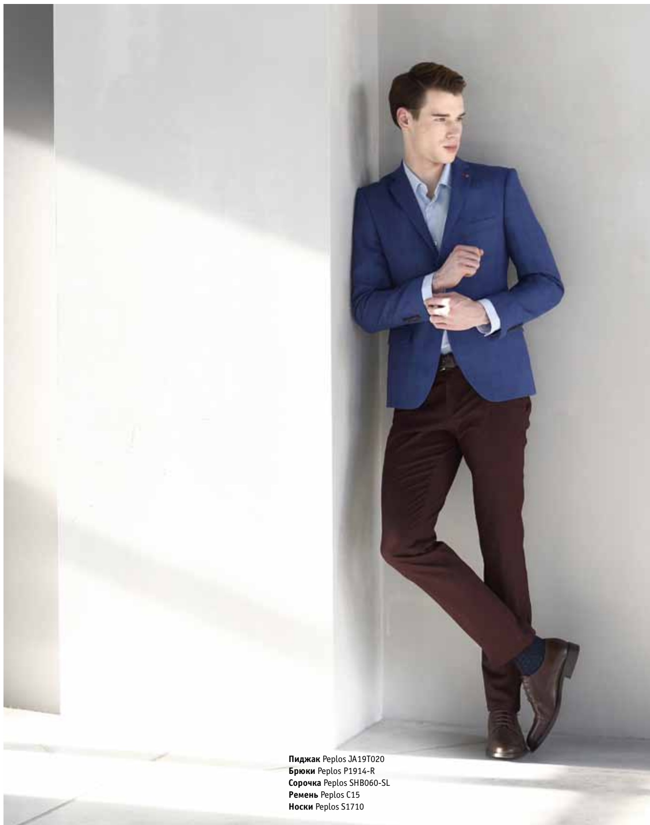
Пиджак Peplos JA19T020 Брюки Peplos P1914-R Сорочка Peplos SHB060-SL Ремень Peplos C15 Носки Peplos S1710

СТРОГИЕ ОБРАЗЫ ДЛЯ ВЫПУСКНОГО ДАВНО УШЛИ В ПРОШЛОЕ, СЕЙЧАС ПАРНИ ГОТОВЫ ВЫГЛЯДЕТЬ ЭФФЕКТНО, А ГЛАВНОЕ МОДНО