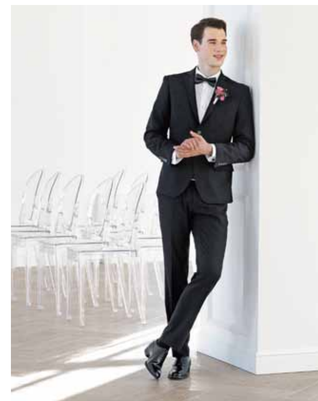
Костюм Peplos SU19006-R Сорочка Peplos SH19005-SL Галстук-бабочка Peplos