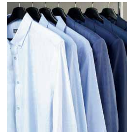
В новой коллекции весна-лето 2019 среди сорочек преобладают сиреневые, синие и голубые цвета.