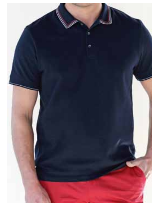
СЛЕВА: Рубашка-поло Peplos TS19016-P Шорты Peplos S1917-SL