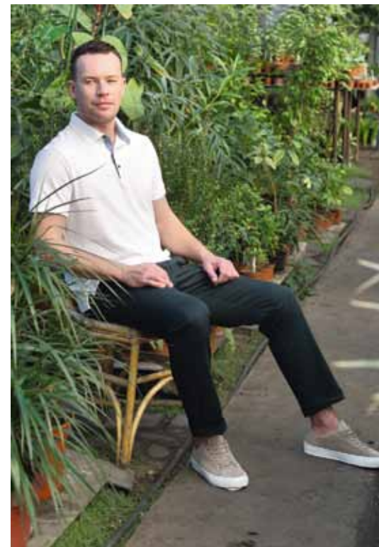
Рубашка-поло Peplos TS19005-P Брюки Peplos P1913-R

Еще один вариант рубашки-поло из новой коллекции весна-лето 2019. Широкий размерный ряд и многообразие цветов – любой модник найдет поло для себя.