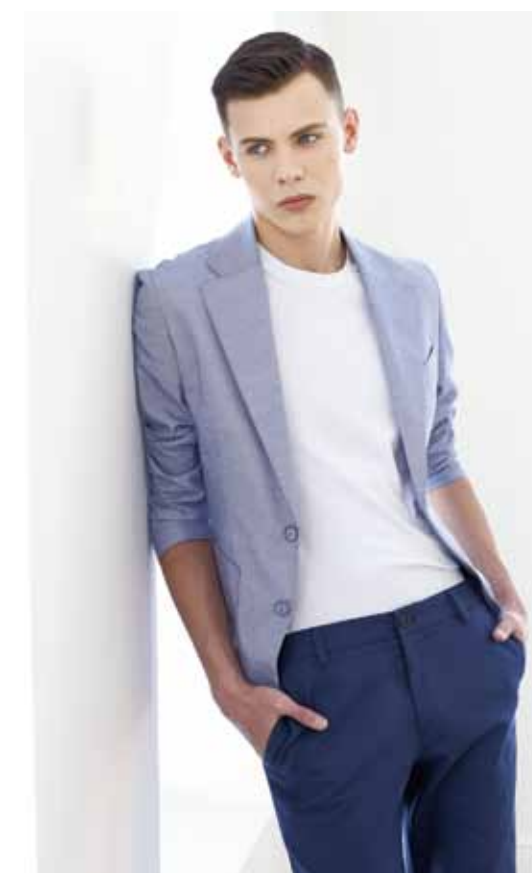
Пиджак Peplos JA19020-SL Брюки Peplos P1910-SL Футболка Peplos TS-BR-7