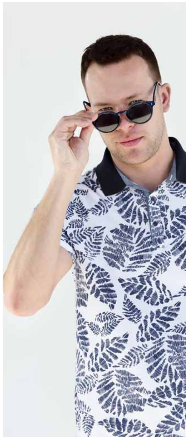
Рубашка-поло Peplos TS19004-P Шорты Peplos S1917-SL