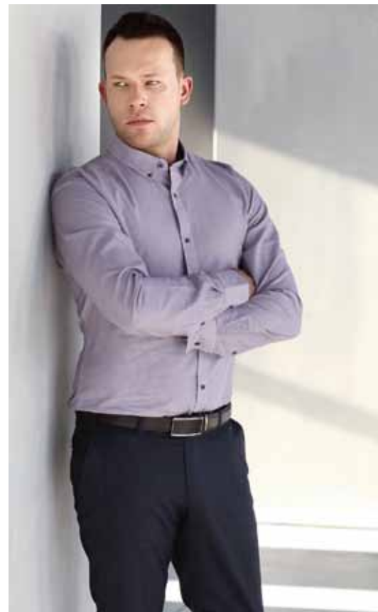
Сорочка Majestic Legate SH19124-SL Брюки Peplos TR19017-282 Ремень Peplos C21