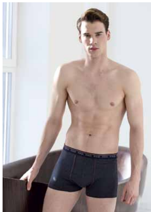
СВЕРХУ: Трусы-боксеры Peplos UW19011-BX СНИЗУ: Трусы-боксеры Peplos UW19006-BX