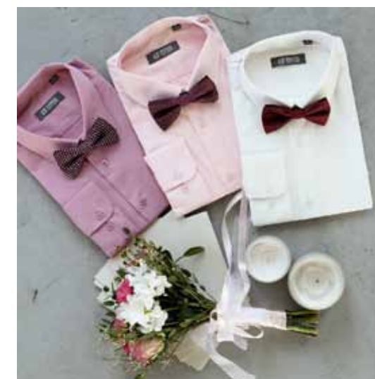
Сорочка Peplos SHB001-SL Сорочка Peplos SHB030-SL Сорочка Peplos SHB031-SL Галстук-бабочка Peplos

Для торжеств мы рекомендуем выбирать более смелые цвета сорочек – шампань, розовый, они будут всегда уместны в таких случаях.