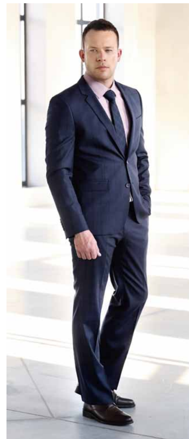
Костюм MAJESTIC LEGATE SU19902-R Ткань 11347 цв. 916 Сорочка Peplos SHB032-SL Галстук Peplos