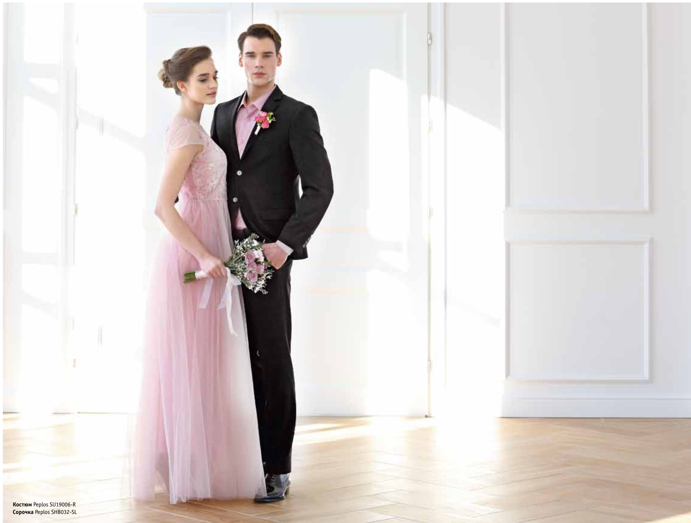
Костюм Peplos SU19006-R Сорочка Peplos SHB032-SL